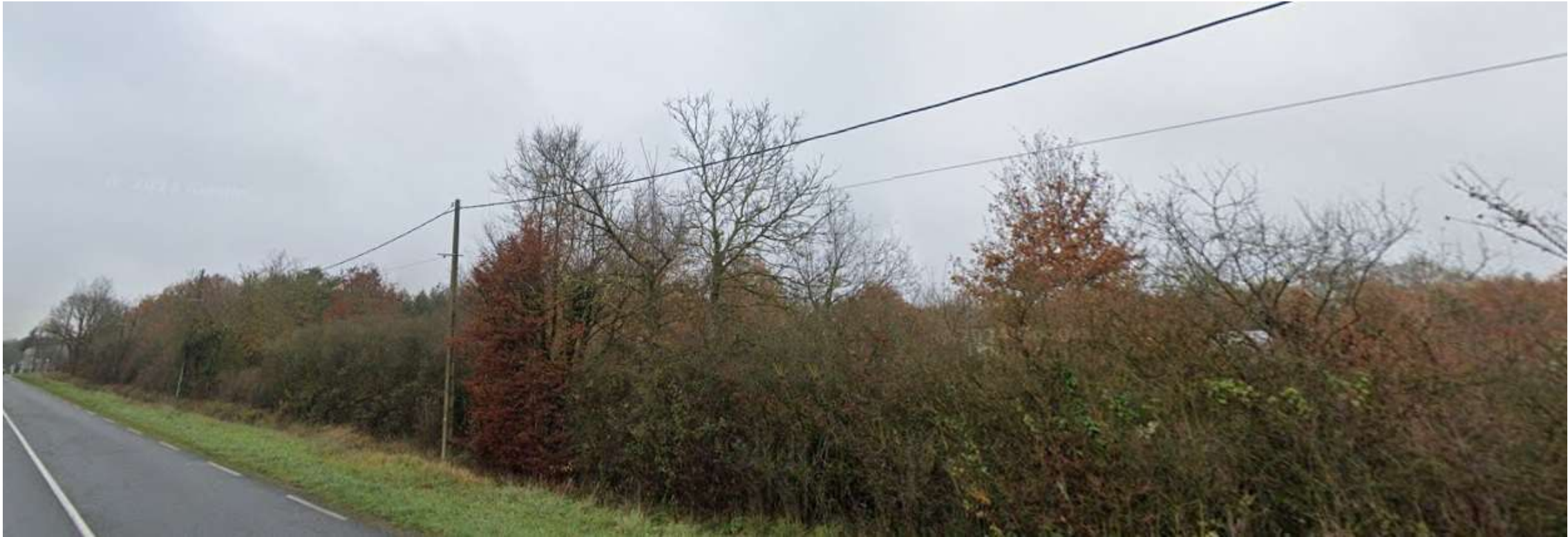
PDV 2 - Localisation du projet dans son environnement lointain