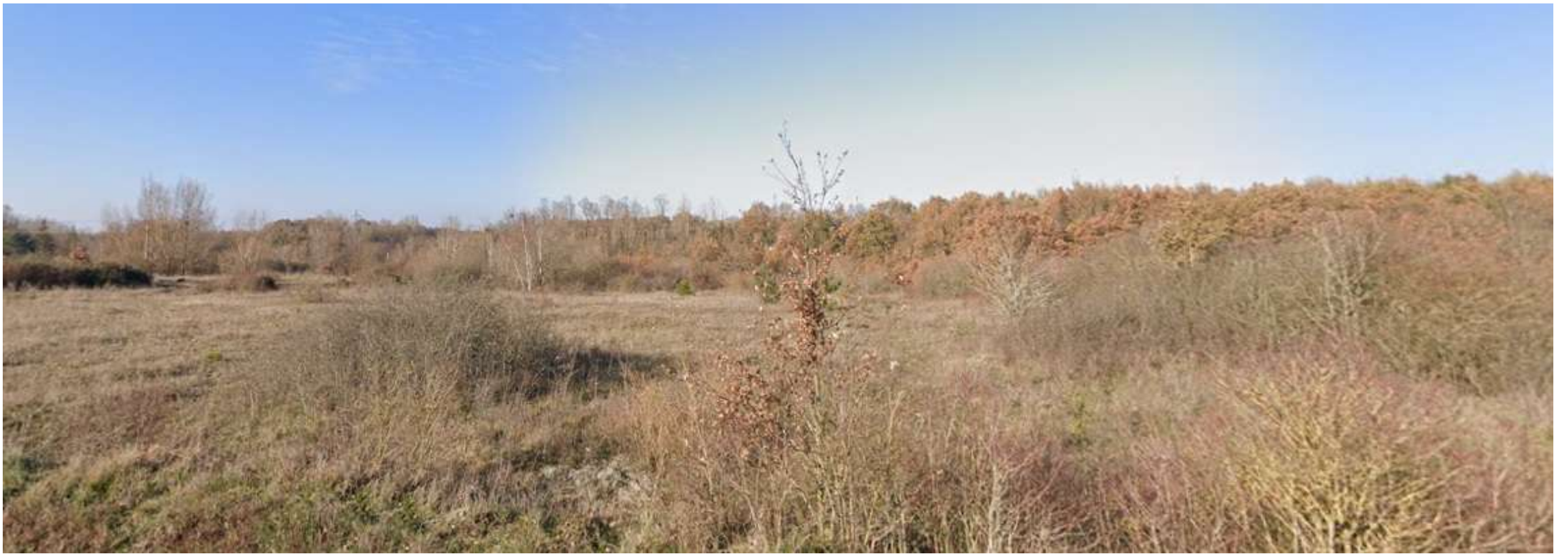
PDV 1 - Localisation du projet dans son environnement proche